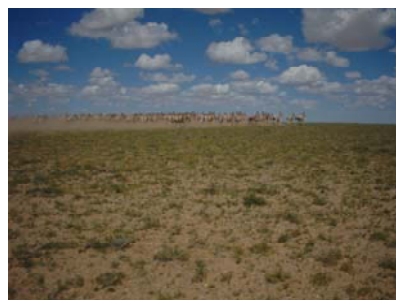
疾走するアジアノロバの群れ