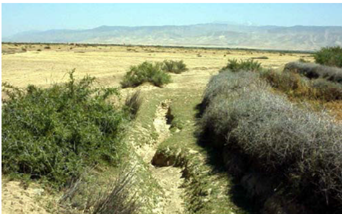
(写真1)洪水時のみ働く灌水路

このような施設は完全な施設ではない。建設に時間はかかるが金はいらない。壊れてしまうこともあるが努力さえすれば自分らで何とか修理出来る。農民たちの力だけでも動かせるこのような施設と今後考えられる導入施設の調和をどうにかして見出せないものだろうか。現地で得た知識をいかに我々の業務に生かし、どんな形で彼らの知恵を利用できるかを考えながら進めたいものだ。（モロッコ：財津）