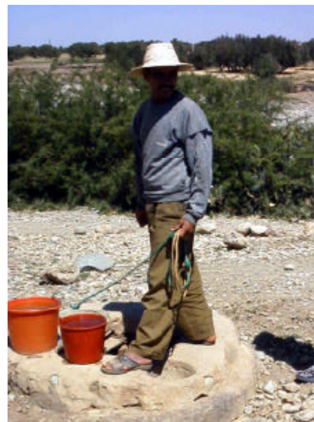
(写真2) 洪水時の水を貯める地下貯水槽